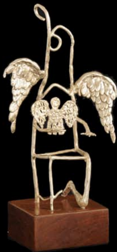
Ángel..... (PLATA) 10 x 17 cm. Material: plata. Técnica: fundición a la cera perdida. 2002.