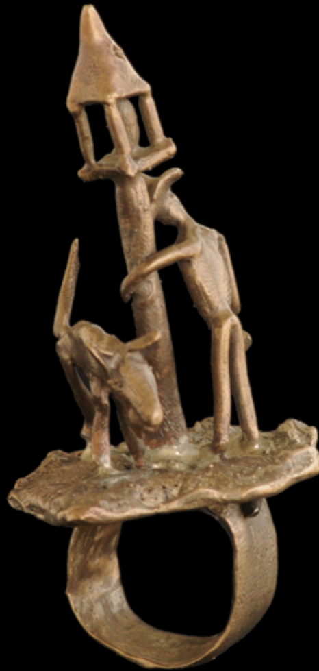
Arrastrando la cobija. 4.5 x 8 cm. Material: bronce. Técnica: fundición a la cera perdida. 2008.

Esa noche me emborrache, por que rompí con mi novia. Sufría una pena de amor. Andaba arrastrando la cobija esa noche. Había tantas cosas que no entendía, ¿cómo llegó a suceder?. Me lamentaba de mi mala suerte y pensé: "sólo falta que me mee un perro?, y como hueso, que llega un perro a orinar en el poste que me sostenía.