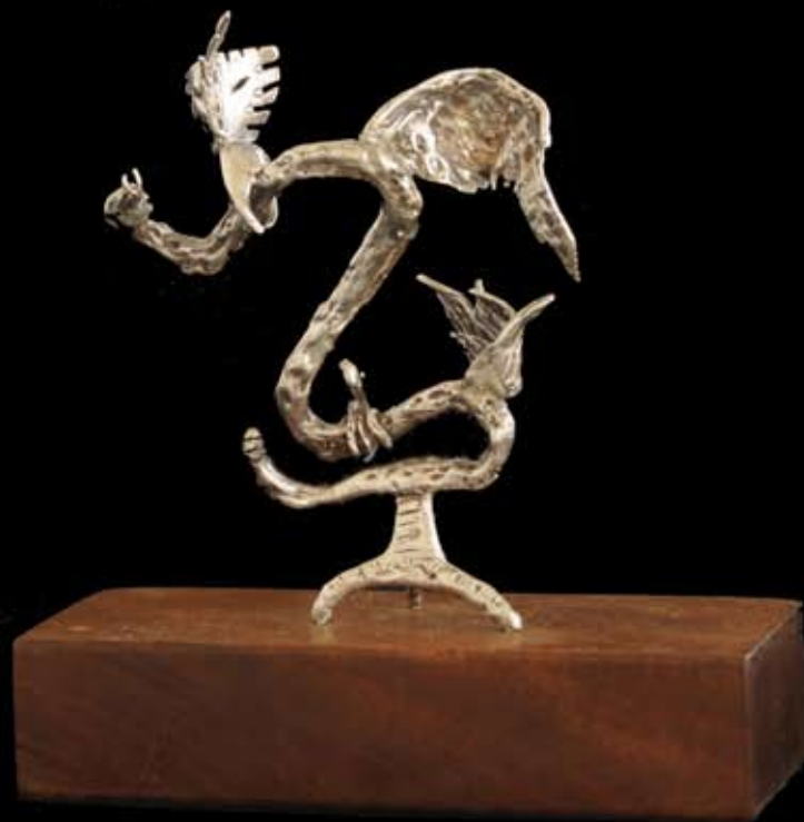
Mis espíritus luchando..... (PLATA) 9 x 11.5 cm. Material: plata. Técnica: fundición a la cera perdida. 2002.