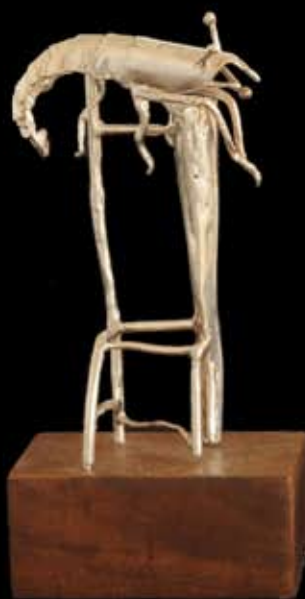
Camarón..... (PLATA) 7 x 11 cm. Material: plata. Técnica: fundición a la cera perdida. 2002.