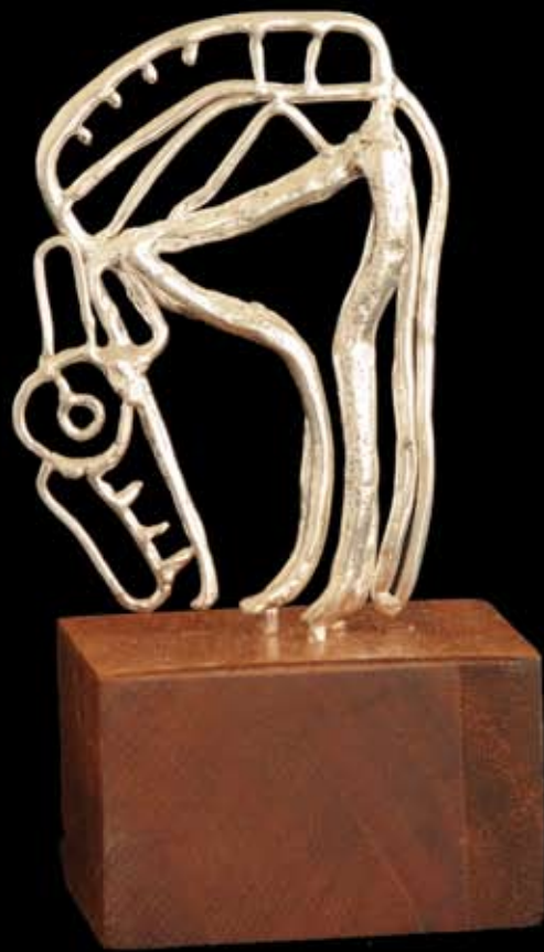
Perro oliendo..... (PLATA) 6 x 8.5 cm. Material: plata. Técnica: fundición a la cera perdida. 2002.