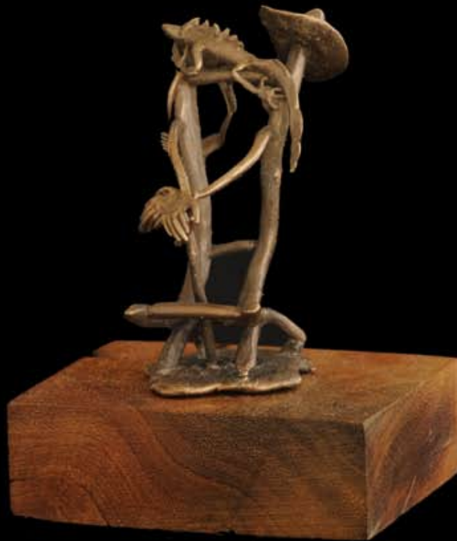
Butaque del tío el puro. 6 x 9 cm. Material: bronce. Técnica: fundición a la cera perdida. 2008.