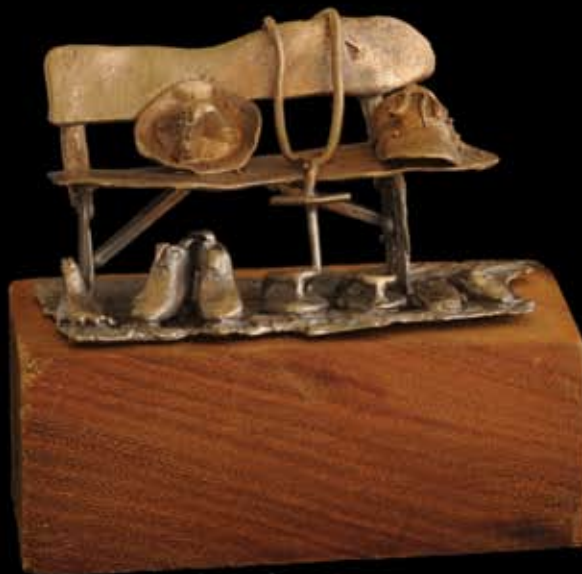
Yo's en la banca. 5 x 8 cm. Material: bronce. Técnica: fundición a la cera perdida. 2008.