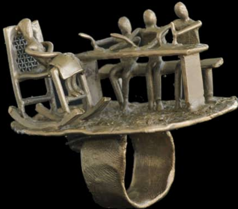
Silabario: ele, a :la ; pe, e: pe ; ele, o :lo ; te, a :ta. ¿Cómo dice? 5.5 x 6 cm. Material: bronce. Técnica: fundición a la cera perdida. 2008.

Había una maestra, que en el patio de su casa, tenía unas bancas de madera debajo de los mangos, que utilizaba para que se sentaran los niños, que asistían para aprender a leer. Por las mañanas se oía el griterío de los niños, al repetir en voz alta la palabra sílabas por sílabas que se tenía que aprender. El silabario diario tenían que repetir, ele, a :la ; pe, e: pe ; ele, o :lo ; te, a :ta: ¿cómo dice? hasta que aprendieran a leer.